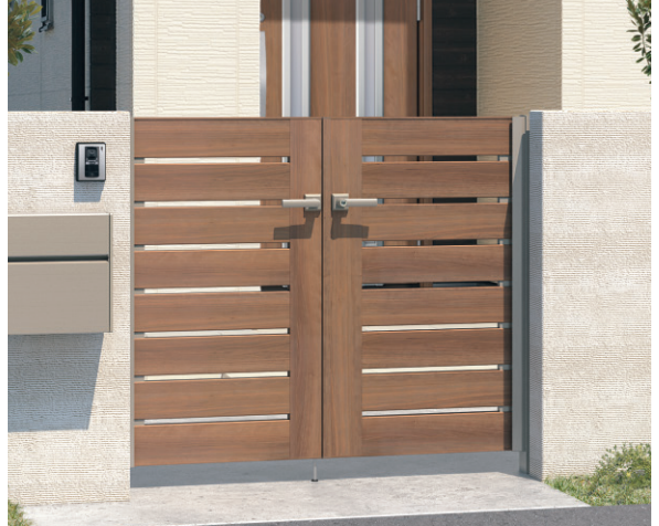
JCU(オレンジチェリー・アーバングレー) / 門柱色:アーバングレー/打掛け錠 0712/すき間ガード(吊元側)