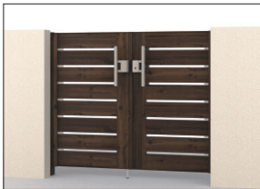
TPU(トラッドバイン・アーバングレー) 門柱色:トラッドバイン/タッチ錠(押し棒タイプ) 0712/すき間ガード(吊元側)