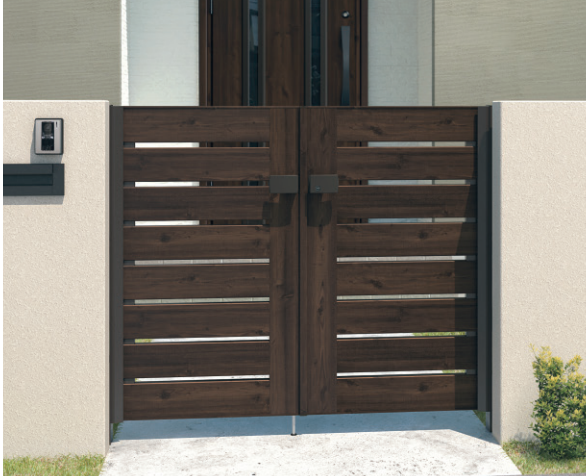
TPC(トラッドバイン・ダークブロンズ) / 門柱色:ダークブロンズ/タッチ錠(スタンダードタイプ) 0712/すき間ガード(吊元側)