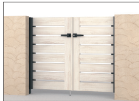
YNK(シルキーノーチェ・ブラック) 門柱色:ブラック/打掛け錠 0712/すき間ガード(吊元側)