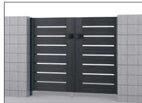
HGK(ビターグレイン・ブラック) 門柱色:ブラック/タッチ錠(スタンダードタイプ) 0712/すき間ガード(吊元側)