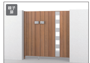
JCL (オレンジチェリー・サンシルバー) 門柱色:オレンジチェリー/タッチ錠(スタンダードタイプ) (08・04) 12/すき間ガード(吊元側)