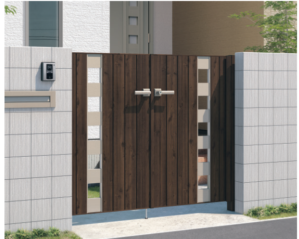
TPU (トラッドバイン・アーバングレー) / 門柱色:トラッドバイン/打掛け錠 0712/すき間ガード(吊元側)