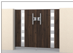
TPL (トラッドバイン・サンシルバー) 門柱色:サンシルバー/タッチ錠(押し棒タイプ) 0712/すき間ガード(吊元側)