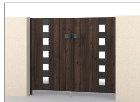
TPC (トラッドバイン・ダークブロンズ) 門柱色:ダークブロンズ/タッチ錠(スタンダードタイプ) 0712/すき間ガード(吊元側)