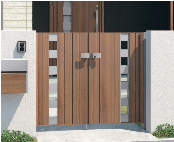
JCL (オレンジチェリー・サンシルバー) / 門柱色:サンシルバー/タッチ錠(スタンダードタイプ) 0712/すき間ガード(吊元側)