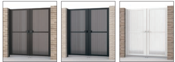
ダークブロンズ/タッチ錠/0818 すき間ガード(吊元側) ブラック/タッチ錠/0818 すき間ガード(吊元側) ホワイト/内蔵錠/0818 すき間ガード(吊元側)