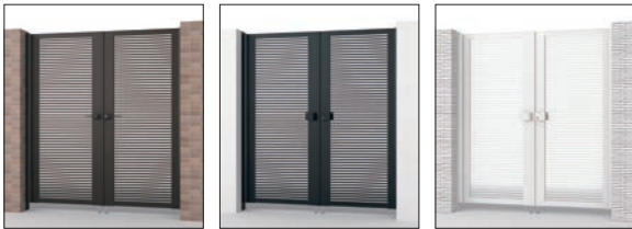
ダークブロンズ/内蔵錠/0818 すき間ガード(吊元側) ブラック/タッチ錠/0818 すき間ガード(吊元側) ホワイト/タッチ錠/0818 すき間ガード(吊元側)