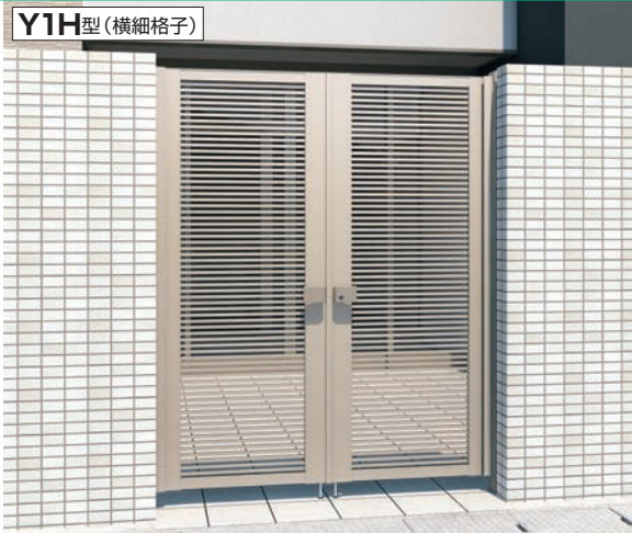
アーバングレー/タッチ錠/0820/すき間ガード(吊元側)

色 アーバングレー(UK) ダークブロンズ(BD) ブラック(KC) ホワイト(WH) 材質 アルミ材