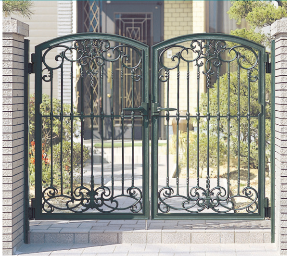
ヨロビアングリーン/打掛け錠/0812