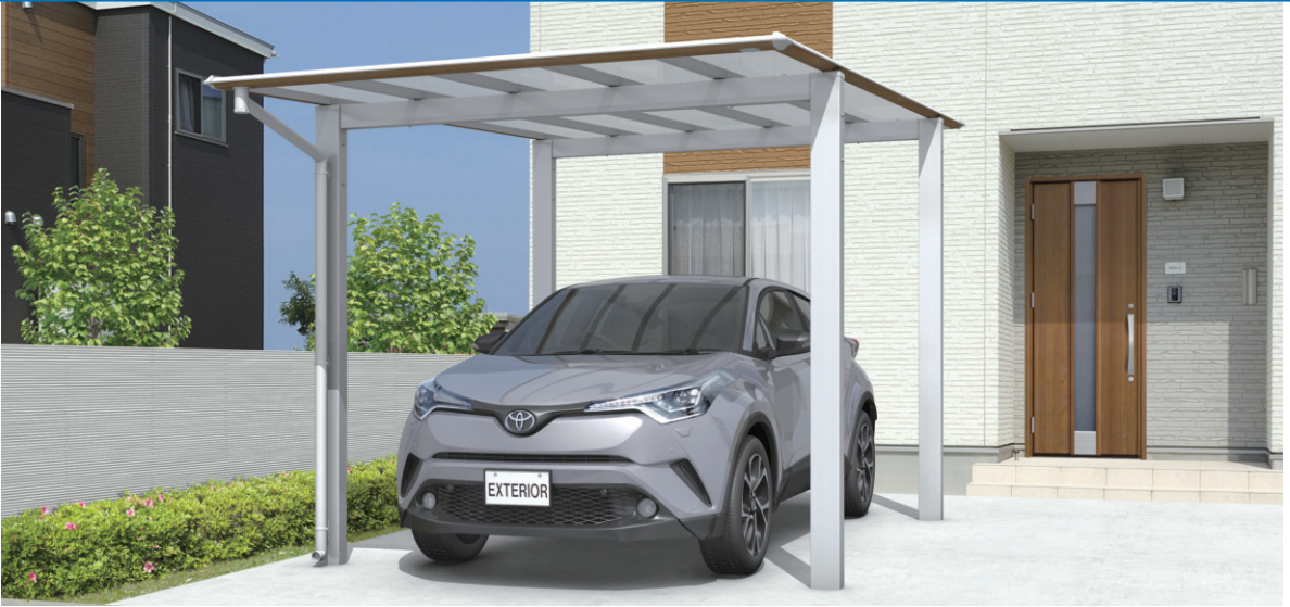
木調屋根枠/JCL(オレンジチェリー・サンシルバー)/基本タイプ/5028/H23/ポリカーボネート板(かすみ調):かすみ