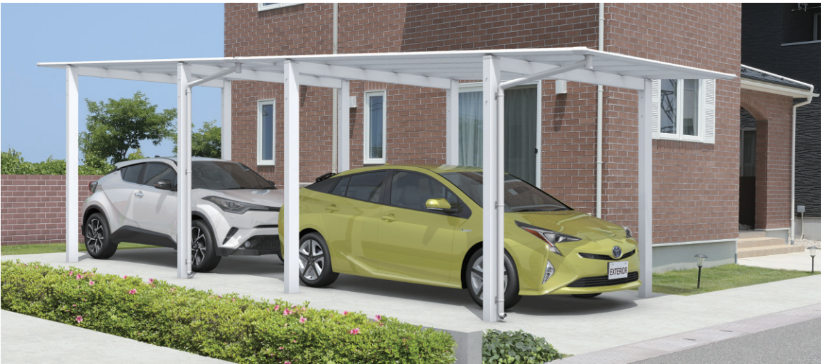
形材屋根枠/ホワイト/奥行2連結タイプ/(50・50)28/H23/ポリカーボネート板(かすみ調):かすみ