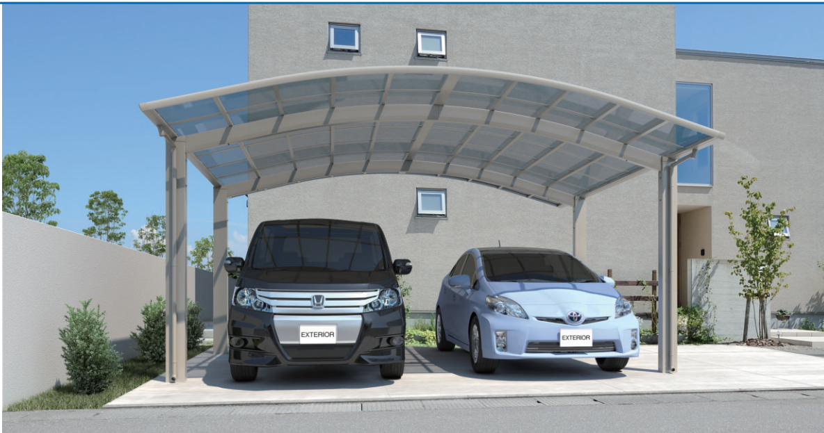
アーバングレー / 基本タイプ / 5054 / H23 / ポリカーボネート板: ブルースモーク