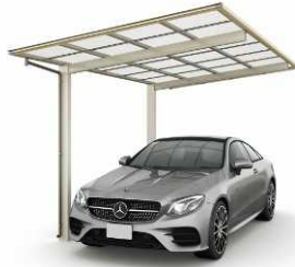
51-27H ハニーチェリー/ステン色 (ポリカ屋根ふき材:クリアマット色)