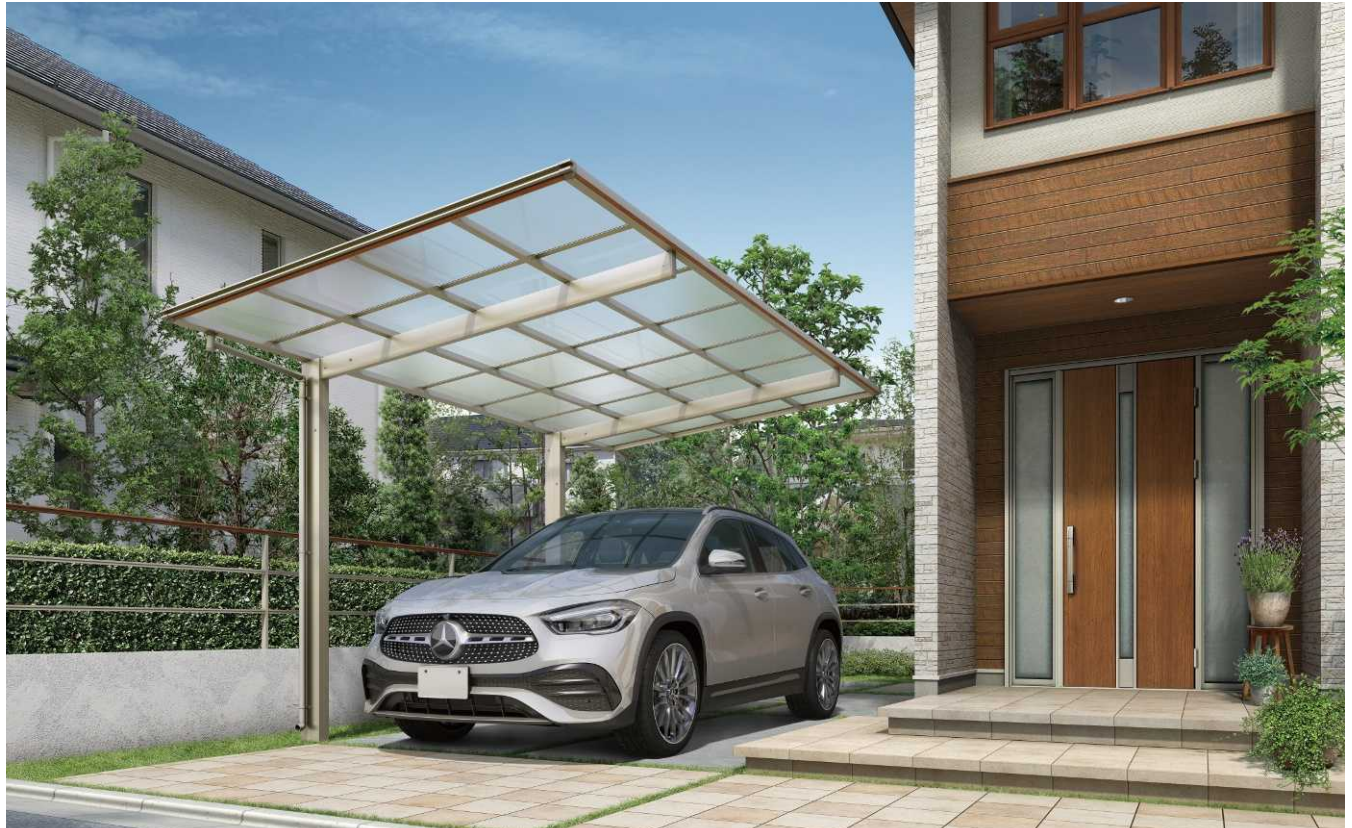
51-27H キャラメルチーク/ステン色(ポリカ屋根ふき材:クリアマット色)

アリユース カーポート レイトナポート ファクトポート・S レオンポルトneo ジーポルトneo ソーラーパネル 搭載用