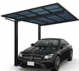
51-27H ショコラウォールナット/ブラック色 (熱線遮断ポリカ屋根ふき材:アースブルー色)