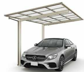
51-27H ショコラウォールナット/ステン色 (ポリカ屋根ふき材:クリアマット色)