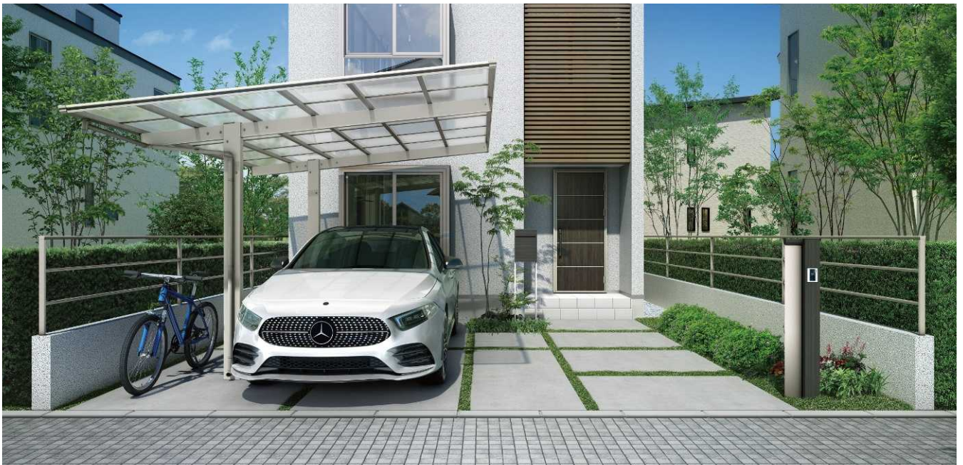
57-2712H 桑炭/ステン色 (ポリカ屋根ふき材: トーマイマツ色)