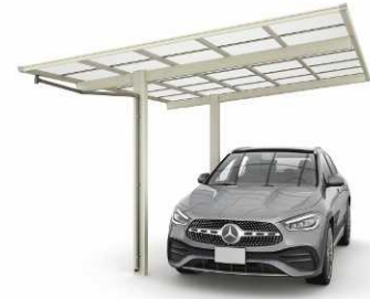
51-2712H プラチナステン色 (熱線遮断ポリカ屋根ふき材: クリアマツ色)