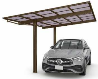
51-2712H ブラウン色 (ポリカ屋根ふき材: スモークブラウン色)