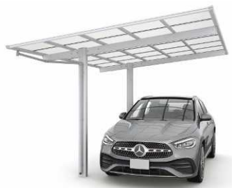
51-2712H ピュアシルバー色 (熱線遮断ポリカ屋根ふき材: クリアマツ色)

注意 ●耐荷重性能600N/m 2 (61.2kgf/m 2 、目安として積雪20cm相当) 以上の重さをかけないでください。商品に破損のおそれがあります。 ※上の数値は比重0.3・積雪量1cmあたり30N/m 2 (3kgf/m 2 ) で計算しています。湿った雪の場合、1cmあたりの重さがさらに大きくなる場合がありますので、早めに雪おろしを行ってください。 ●床面積が30㎡を超えるカーポートは、建築基準法上、延焼ライン外に設置してください。 ●カーポートの屋根が強風であられるのを避けるために、前枠、補助柱側を建物に向けて施工してください。