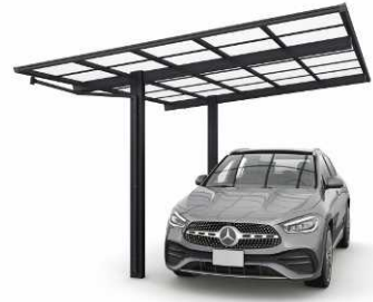
51-2712H カムブラック色 (ポリカ屋根ふき材: トーマイマツ色)