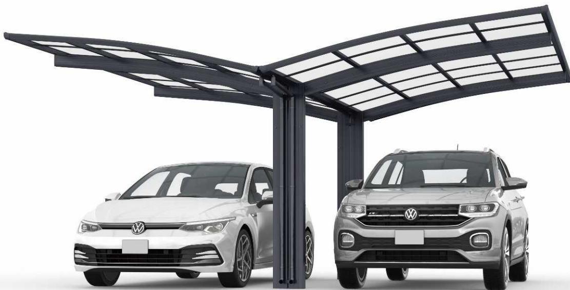
Y51・27-27H カームブラック色(ポリカ屋根ふき材:トーメイマツト色)