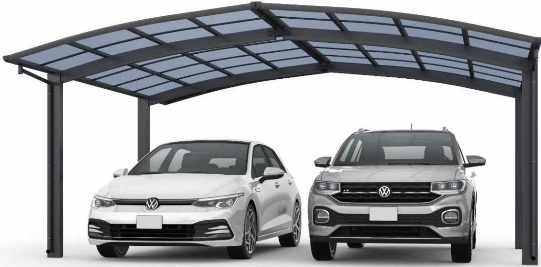
M51・27-27H カームブラック色(熱線遮断ポリカ屋根ふき材:アースブルー色)